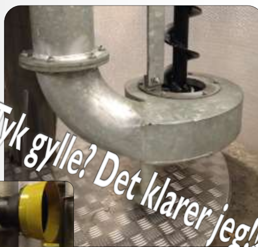
PTO drevne gearkasse 540 / 1000 omdr.

Kimadan pumperne fremstilles efter mål, så de passer til netop din gyllebeholder.