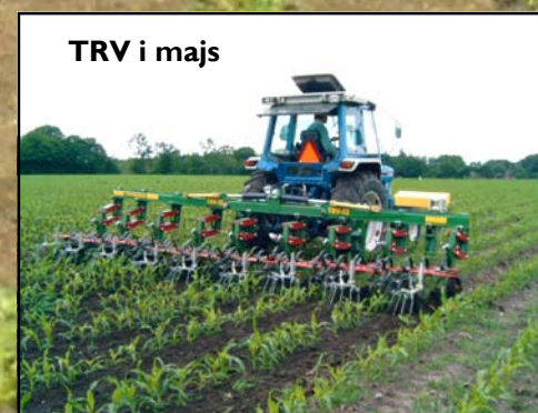
TRV i majs

TRV radrenseren er i princippet konstrueret så den kan anvendes i de fleste rækkeafgrøder, og sektionerne kan justeres til den ønskede række-afstand.