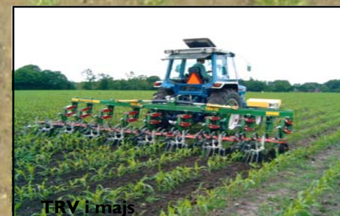
TRV i majs

Som standard är varje sektion utrustad med en effektiv fjäderbelastad efterharv. Efterharven ser till att ogräset kommer upp på ytan och snabbt torkar ut. Den skapar också finjord på ytan för att hindra uttorkning av jorden.