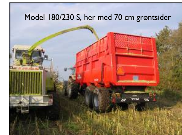
Model 180/230 S, her med 70 cm grøntsider

Fra 15.5 ton er vognen forsynet med en kraftig dobbeltvirkende hydraulisk støttefod.