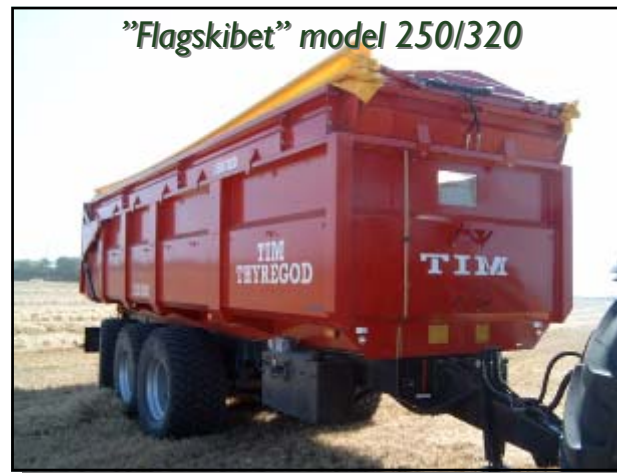
"Flagskibet" model 250/320

Alle vogne er som standard forsynet med vindue i front af vognkasse og kornoverbygning samt forberedt for kornluge (mål på kornudløb 255 mm x 215 mm). Ligeledes er vognen som standard forsynet med stige på vognkasse og trappetrin på trækbo.